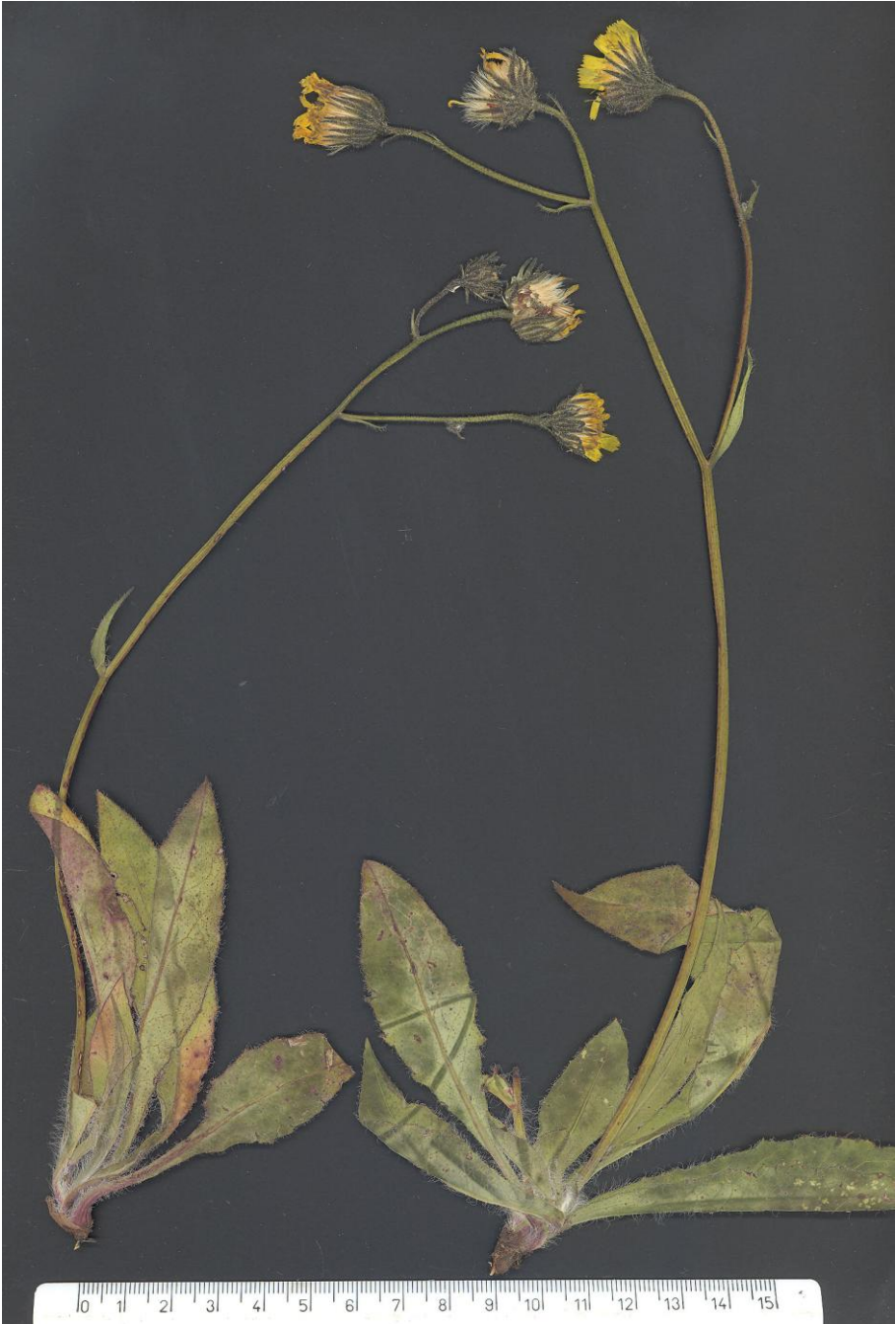
Fig. 6: Hieracium intertextum procedente de las proximidades del Cueto Negro, municipio de Villamanín (León)