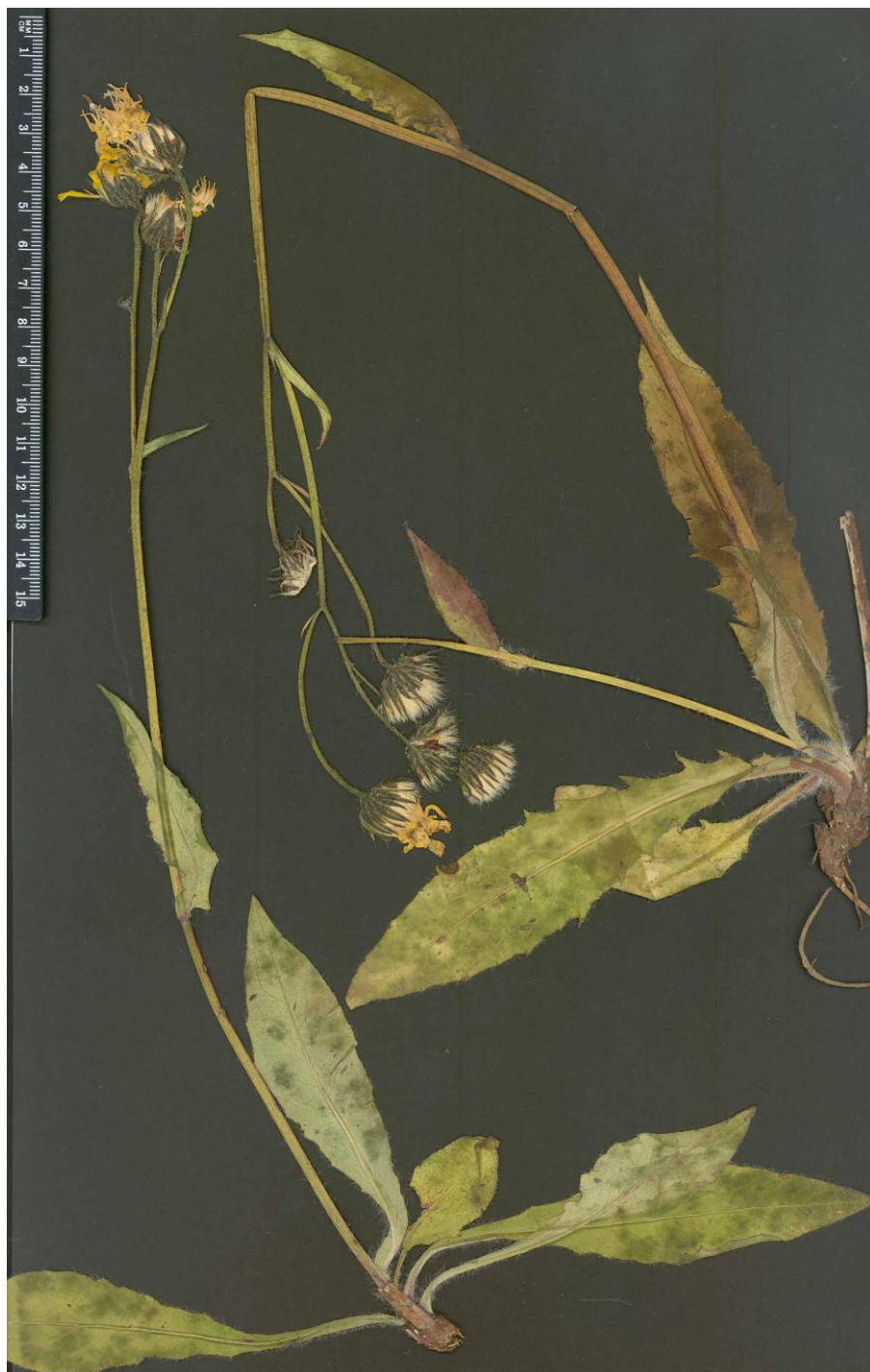
Fig. 5: Typus de Hieracium villamaniniense Mateo & Egidio