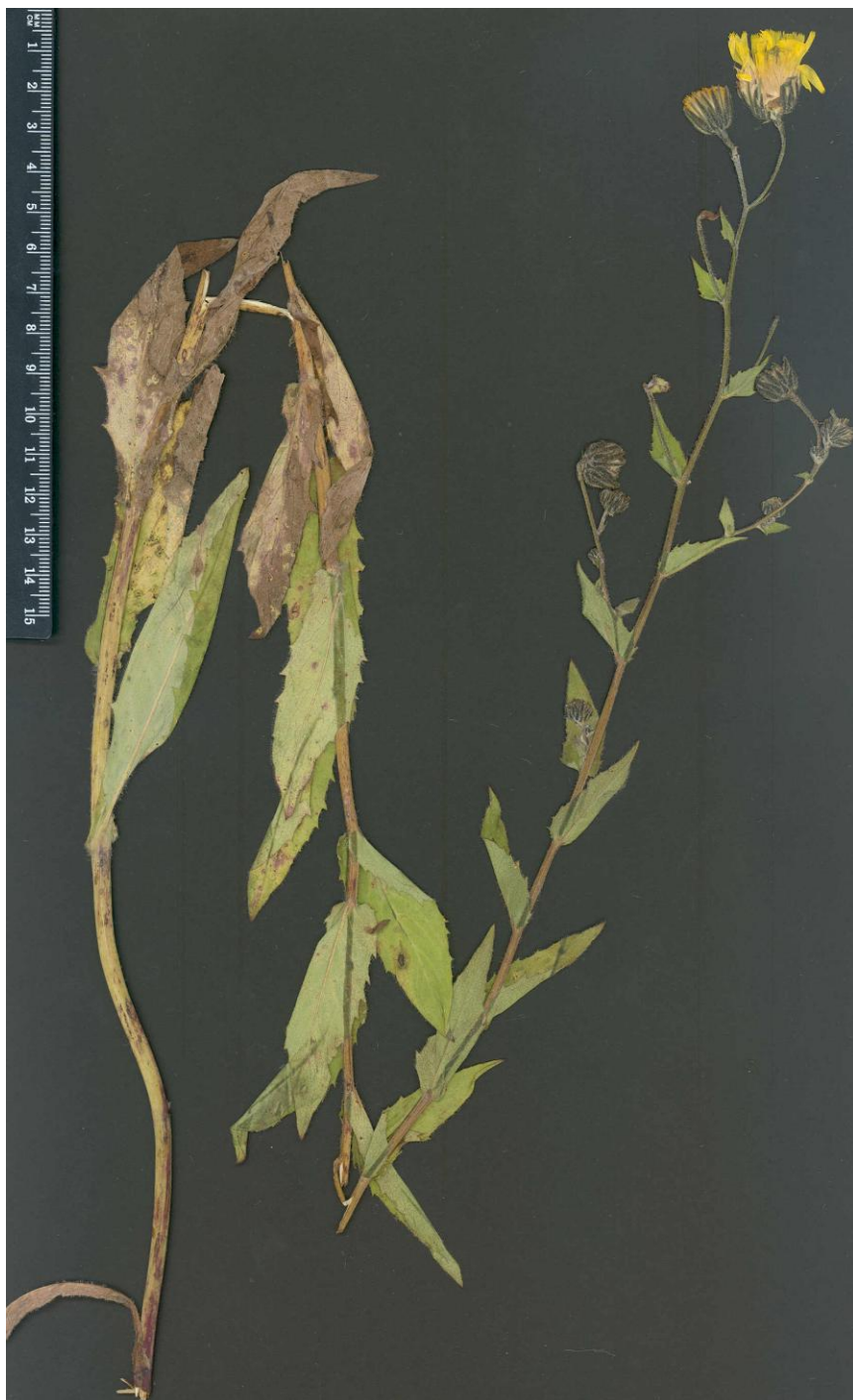
Fig. 3: Typus de Hieracium legiosabaudum Mateo & Egidio