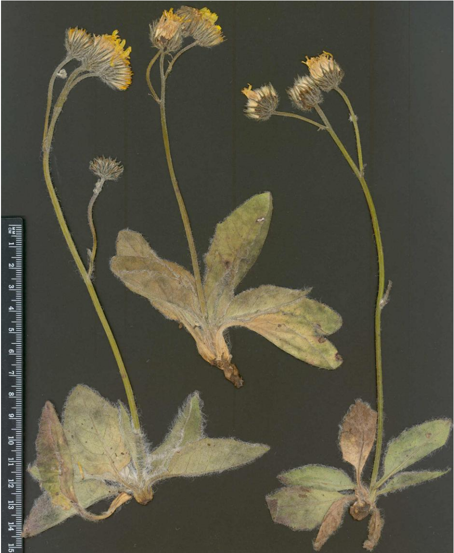
Fig. 2: Typus de Hieracium gordonense Mateo & Egido