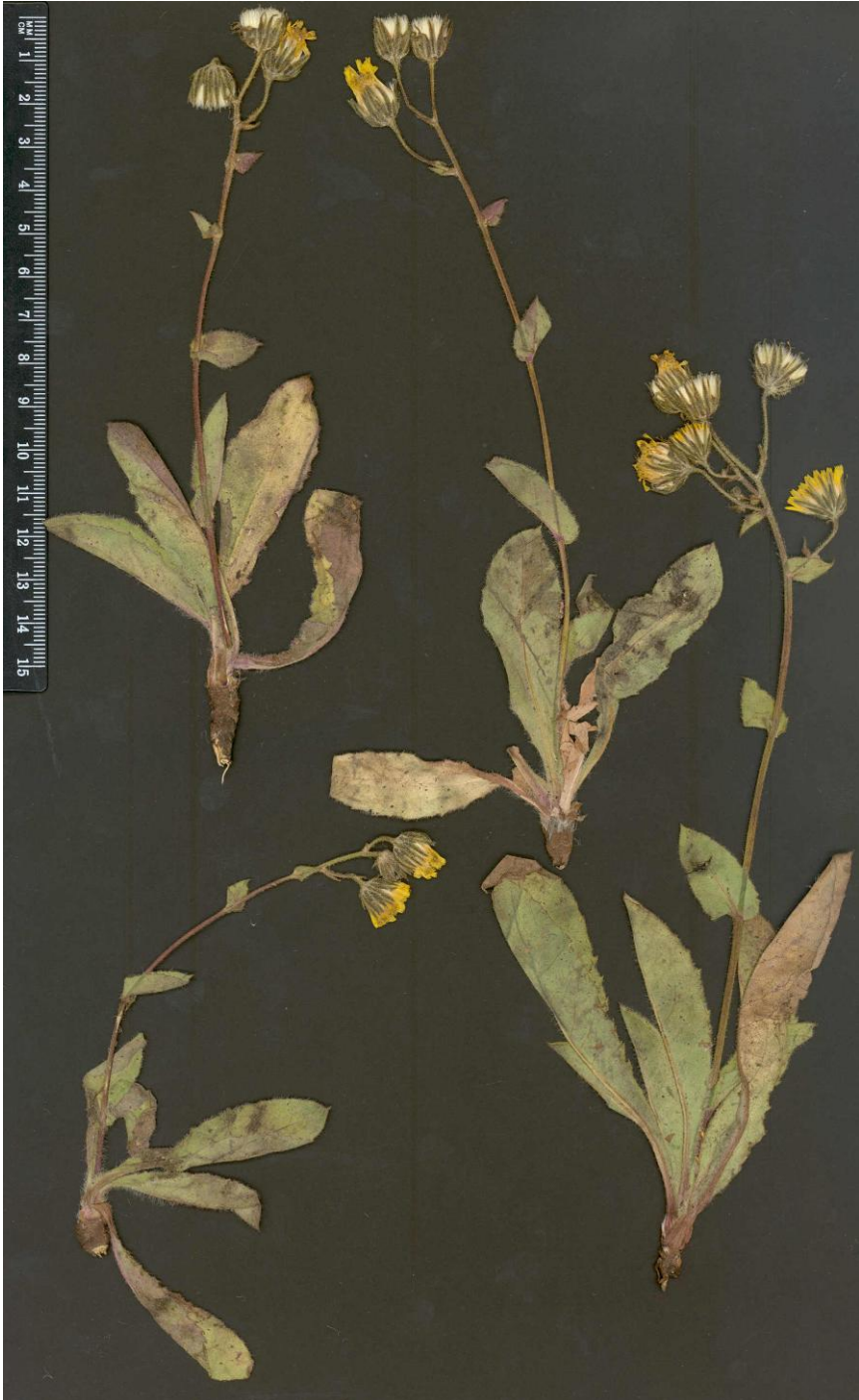
Fig. 4: Typus de Hieracium oroamplexicaule Mateo & Egido