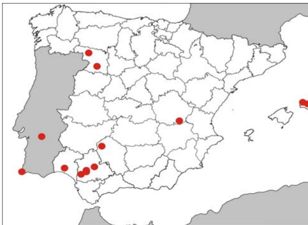
Distribución de Pilularia minuta en España y Portugal.