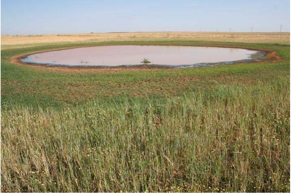
Estado estival del lavajo en el que se ha localizado Pilularia minuta .