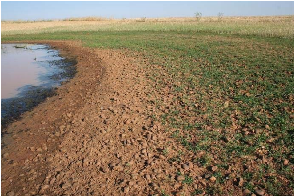
Zona norte del Lavajo en el que se encuentra la población de Pilularia minuta .