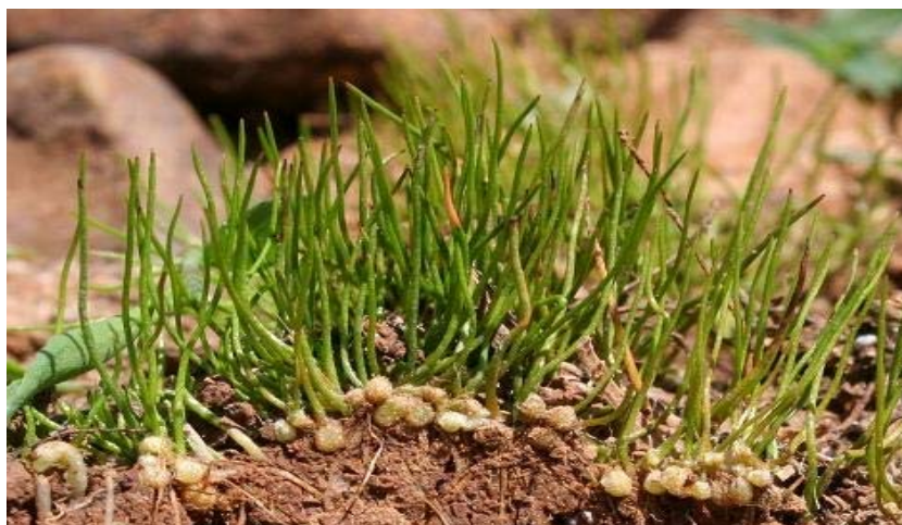
Ejemplares de Pilularia minuta mostrando los sorocarpos.