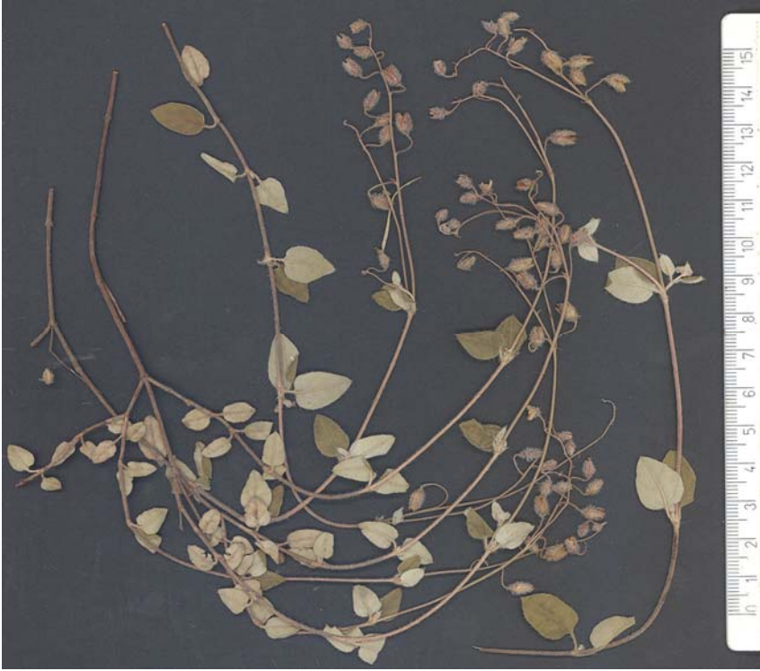
Fig. 2: Helianthemum dichroum , procedente de Llauri (V)