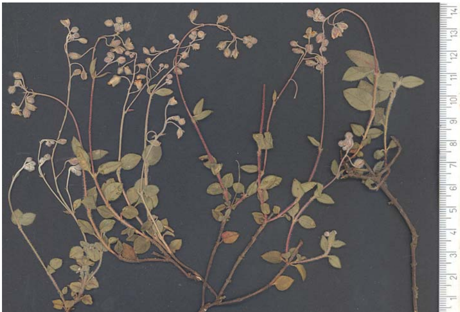
Fig. 3: Tipo de H. origanifolium subsp. saetabense , procedente de Finestrat (A)