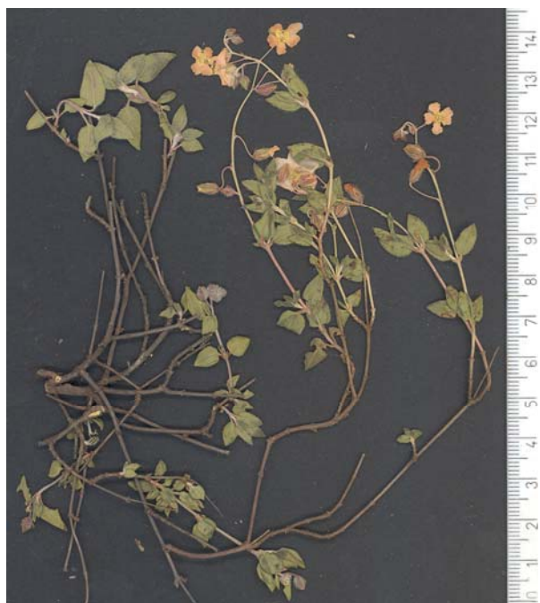
Fig. 5: Helianthemum x caballeroi , procedente de Pina de Montalgrao (Cs)