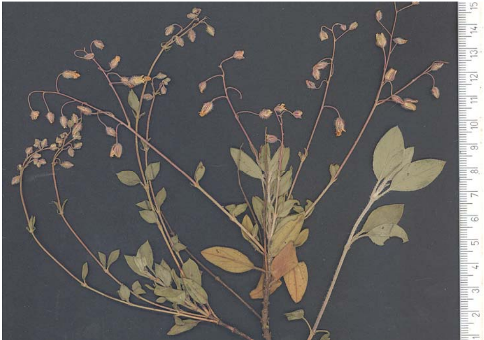
Fig. 7: Tipo de Helianthemum x finestratense , procedente de Finestrat (A)