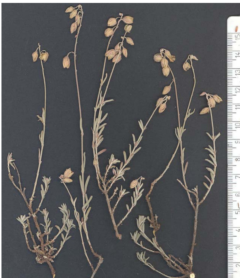
Fig. 11: Tipo de Helianthemum x pseudodianicum , procedente de Alcoy (A)