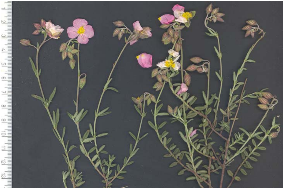
Fig. 1: Ejemplar de Helianthemum dianicum , procedente del Puerto de la Carrasqueta (Jijona, A).