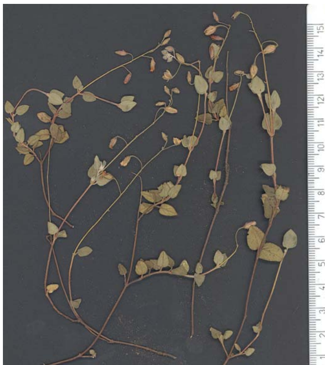
Fig. 4: Tipo de Helianthemum x tornesae , procedente de Puebla Tornesa (Cs)