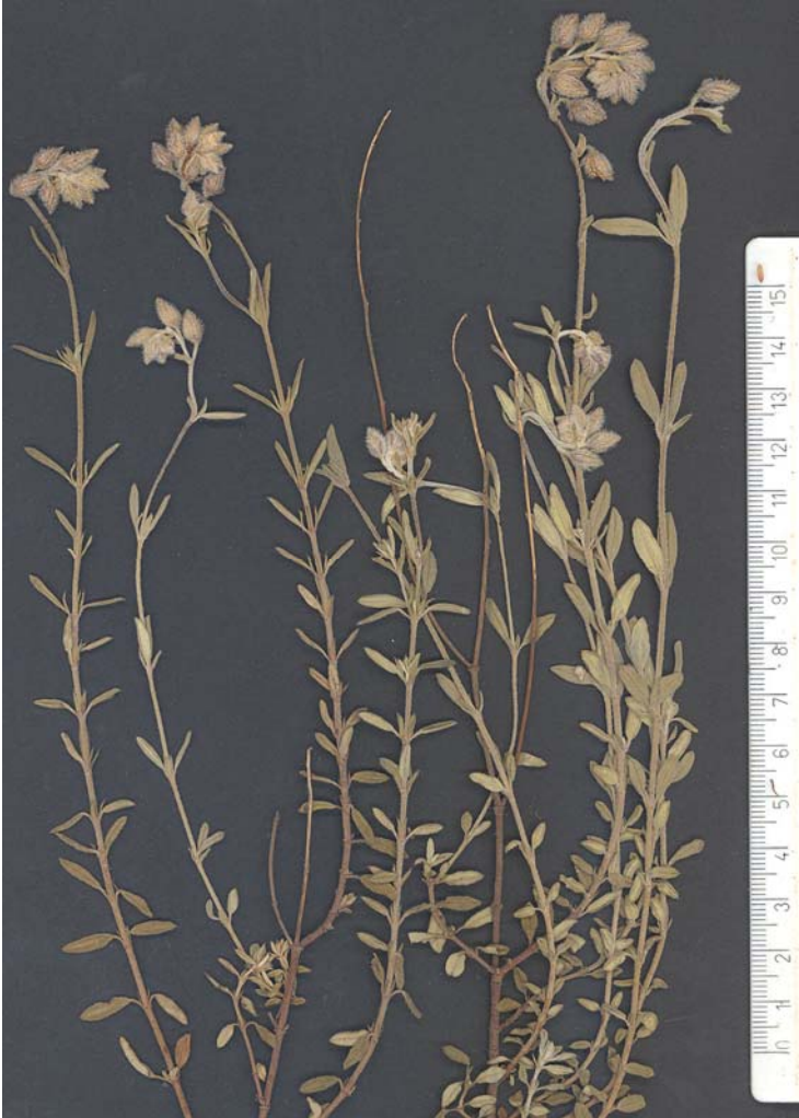
Fig. 10: Tipo de Helianthemum × xixionense , procedente de Jijona (A)