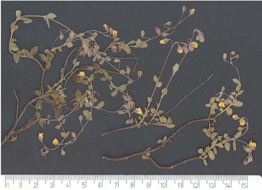
Fig. 6: Tipo de Helianthemum x penyagolosae , procedente de Chodos (Cs)