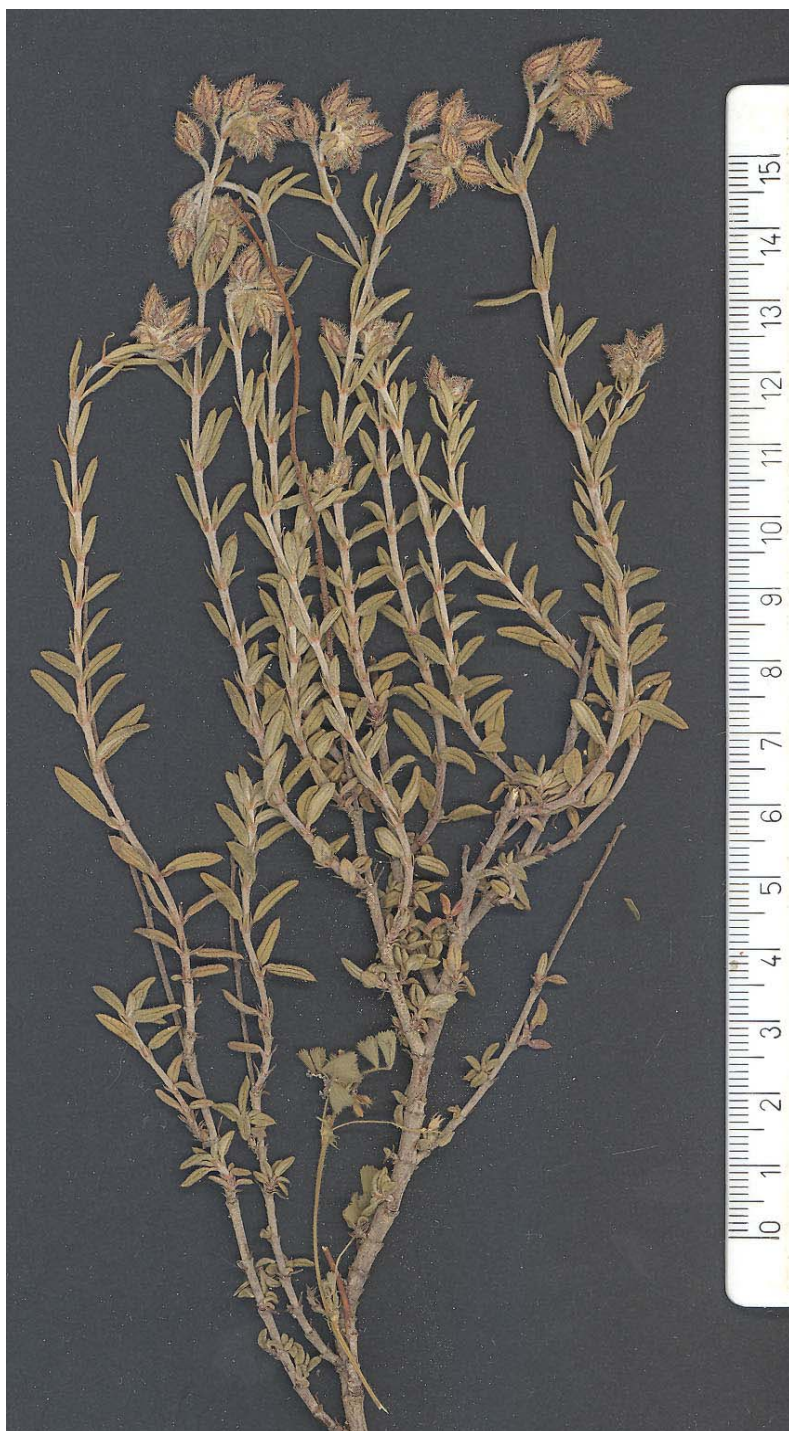
Fig. 13: Tipo de Helianthemum × capralense , procedente de Petrel (A)