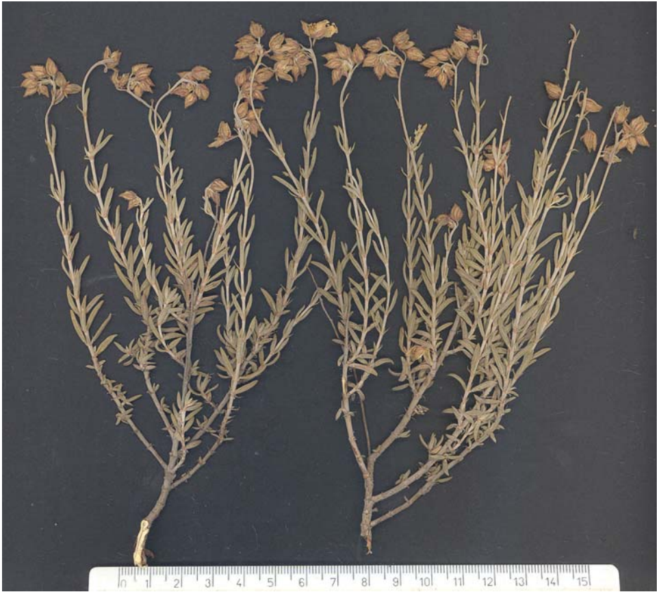
Fig. 12: Tipo de Helianthemum x petrerense , procedente de Petrel (A)