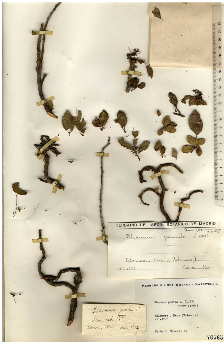
Fig. 2: Lectótipo de Rhamnus valentinus Willd. (MA 76565).

En la colección histórica del autor valenciano, que se conserva en el Real Jardín Botánico de Madrid, se encuentra un pliego (MA 76565; Fig. 2) que porta, entre otras, una etiqueta manuscrita por Cavanilles donde se especifica que sirvió como modelo para la ilustración 181 de su ‘ Rh. pumilus ’, que forma parte del protólogo