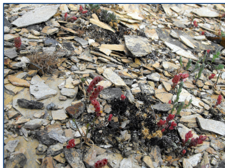
Fig. 1. Hábitat de Sedum aetnense . Pastizales anuales en suelos esqueléticos sobre cuarcitas.

incendios forestales. No obstante los aspectos anteriores requieren de estudios más pormenorizados.