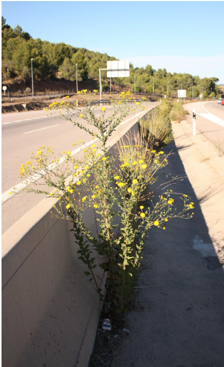
Fig. 1. Heterotheca subaxillaris , en la Poble Tornesa (Castellón).

Heterotheca subaxillaris (Lam.) Britton & Rusby in Trans. New York Acad. Sci. 7(1-2): 10 (1887) = Inula subaxillaris Lam., Encycl. 3: 259 (1789) [basió.] = H. lamarckii Cass. in Dict. Sci. Nat. [F. Cuvier] 21: 131 (1821), nom. illeg.