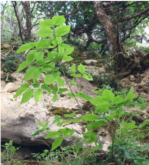
Fig. 3. Ejemplar de E. latifolius observado en Arroyo de los Huecos de Checa (Guadalajara).